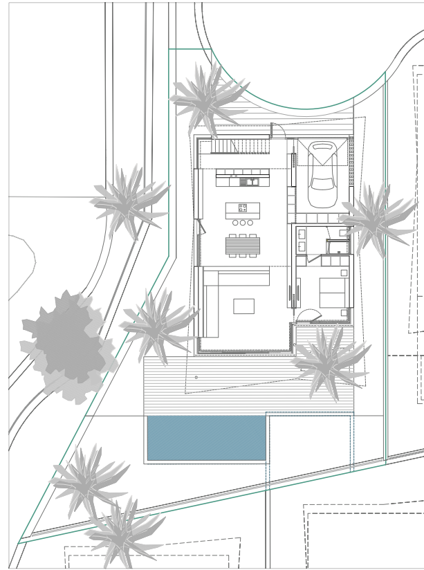
URBANIZATION / URBANIZACIÓN