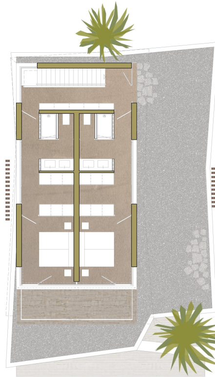
UPPER FLOOR / PLANTA ALTA